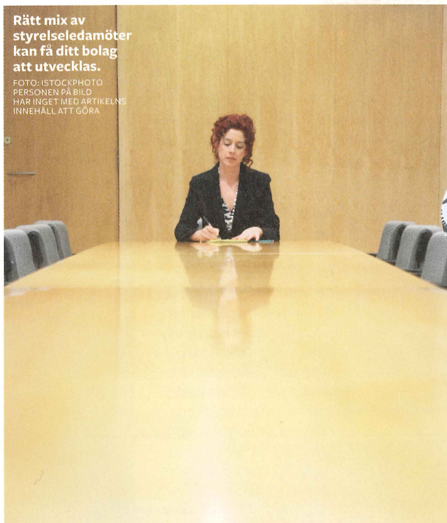
PERSONEN PÅ BILD HAR INGET MED ARTIKELNS INNEHÅLL ATT GÖRA

Rätt mix av styrelseledamöter kan få ditt bolag att utvecklas.